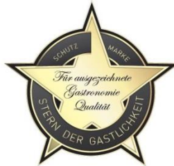
Stern der Gastlichkeit 2023