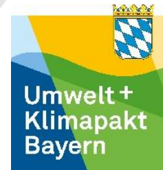
Zertifizierter Teilnehmer beim Umwelt- und Klimapakt Bayern