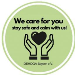
Wohlfühlsiegel für Sicherheit und Schutz DEHOGA Bayern e.V.

WIR HALTEN DIE BEDÜRFNISSE UNSERER GÄSTE IMMER IM BLICK, UND SIND STOLZ AUF UNSERE AUSZEICHNUNGEN.